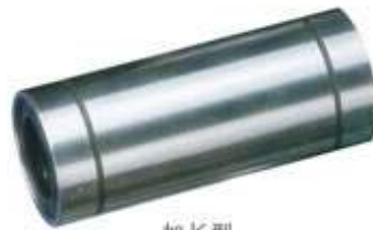
加长型 Long type