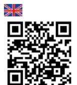
Video Blade exchange