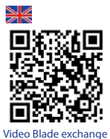
Video Blade exchange