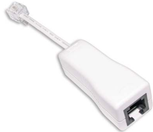
Z-369LS microfiltro residencial ADSL