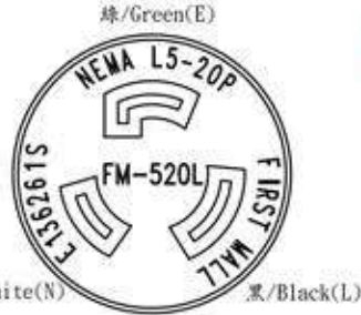
插頭端面圖 (Dimensions of Plug Face)