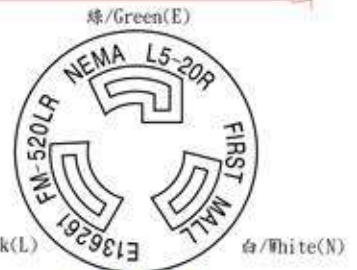
插頭端面圖 (Dimensions of Plug Face)