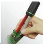
PCB Circuit Conductivity Test