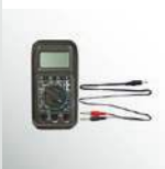
Multimeter Connecting Cable