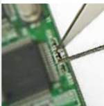
Measuring Small Electronic Components

Messung von kleinen elektronischen Bauteilen