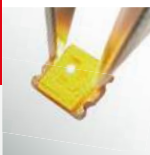
LED Light-up Test