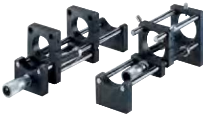
Mounting example of Rod holder and Rod holder G with micrometer