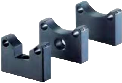
Ahead: Rod holder F Middle: Rod holder G Back: Rod holder