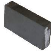
Aimant nu / Single magnet