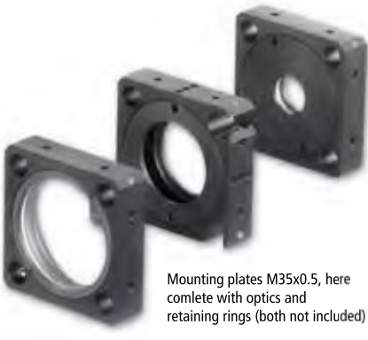
Mounting plates M35x0.5, here complete with optics and retaining rings (both not included)