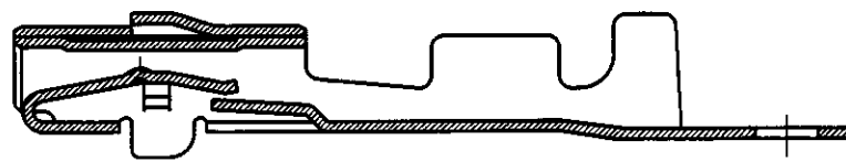
断面 A-A (SECT. A-A)