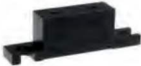
Mounting base MB 50