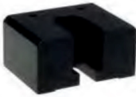
Mounting base MB