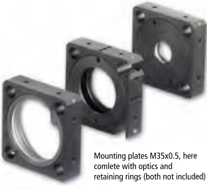
Mounting plates M35x0.5, here complete with optics and retaining rings (both not included)