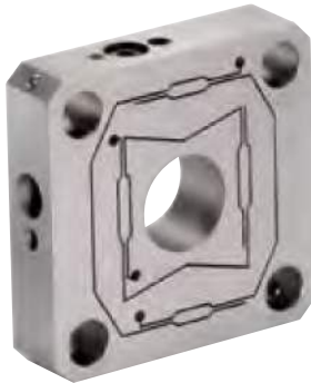
fle.X-plate XY Steel