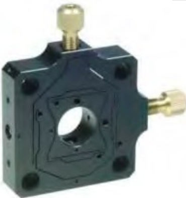
fle.X-plate XY Diff