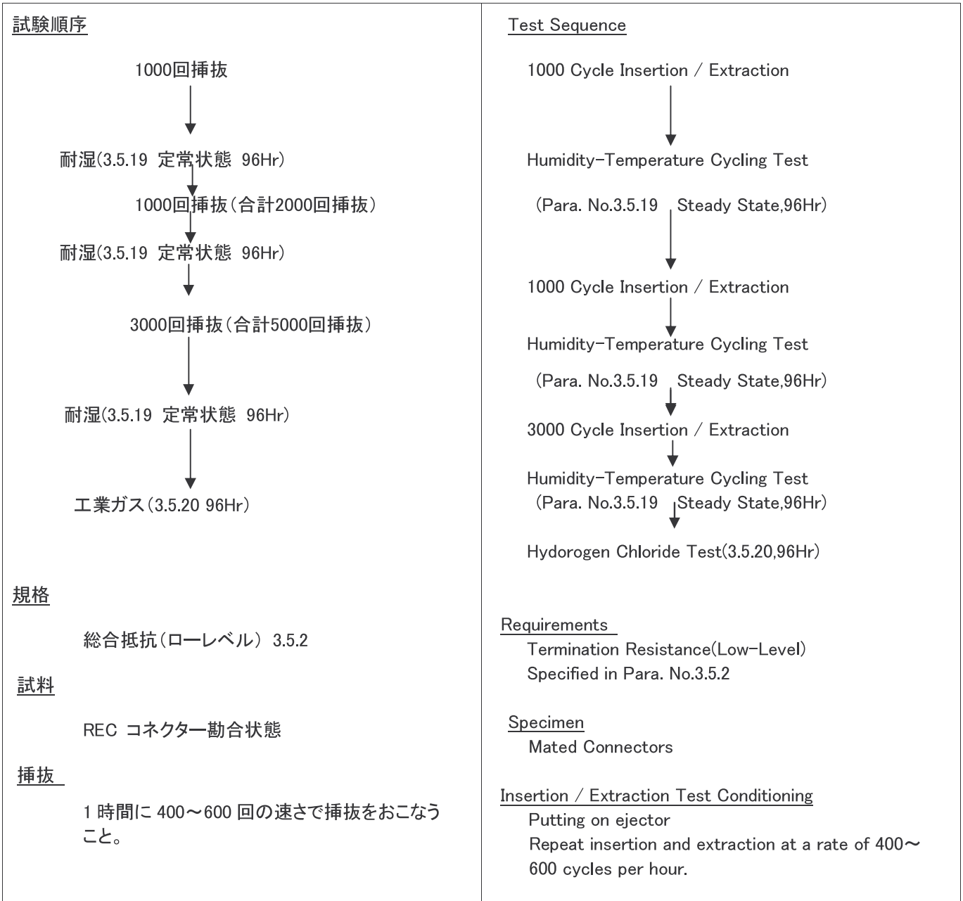
Fig.3 挿抜耐久性(オフィス外環境 5000 回) Fig.3 Durability Test (Harsh Environment)